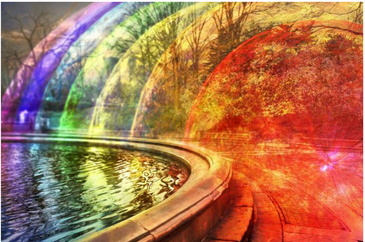
DF8ZR; im Juli 2013