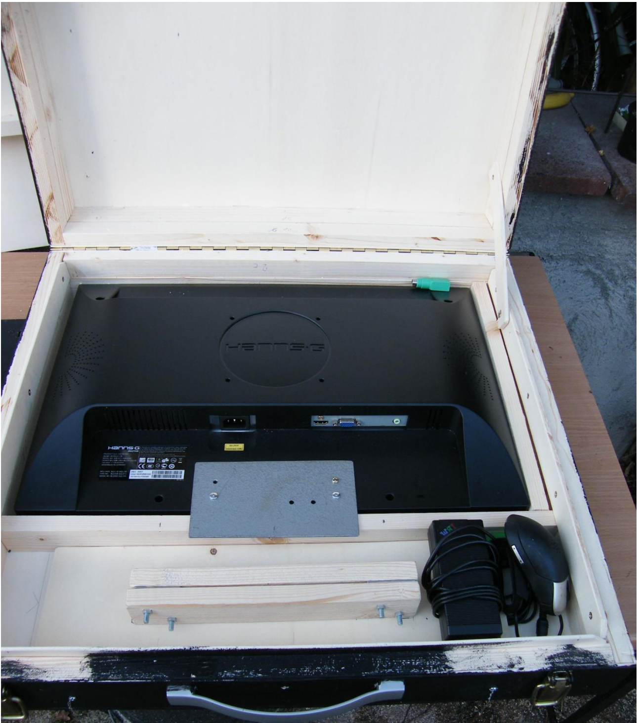
DF8ZR; im Januar 2014